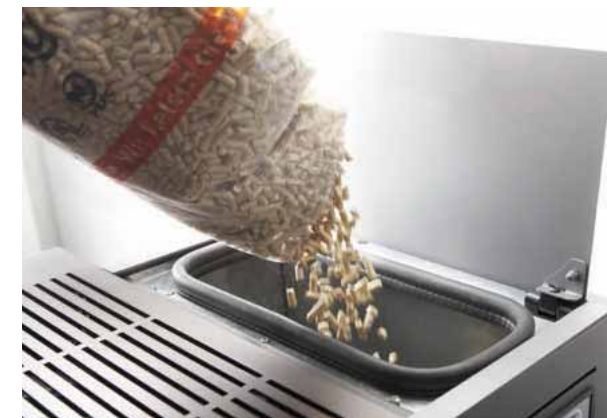
Gut erreichbarer Tank zum Einfüllen der Pellets