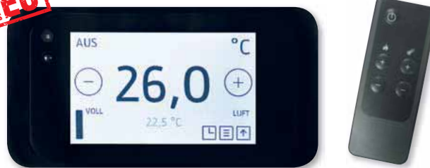
New Generation-Display mit Fernbedienung zur bequemen An-/Abschaltung und zur Temperaturregelung